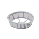
Lieferung mit Trennfilter RCX361511243