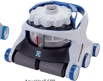
AquaVac® 600 Schaumstoffbürste