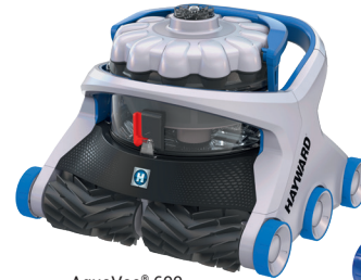
AquaVac® 600 Noppenbürste