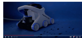
Schau das Video