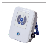
Leichtes und einfach zu bedienendes Netzteil