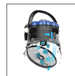
„TouchFree™“: innovativer Auffangbehälter