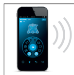
Mit AV650 iPhone®, iPad® und Android kompatible WiFi App