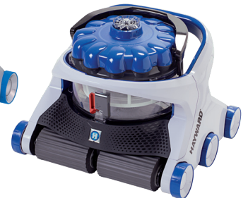
AquaVac® 650 Schaumstoffbürste