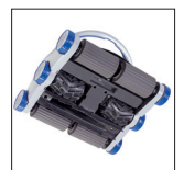
Mit Schaumstoffbürste (für Fliesen-, Mosaik- und Stahlbecken)