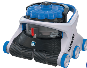
AquaVac® 650 Noppenbürste