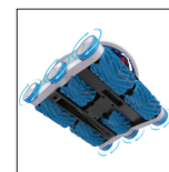
Mit Noppenbürste (für Folien-, PVC-, Glasfaser und Betonbecken)