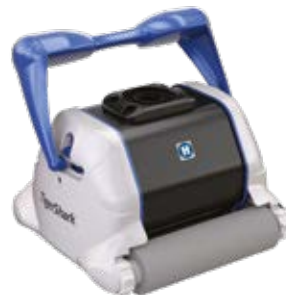
TigerShark® Version Schaumstoffbürste