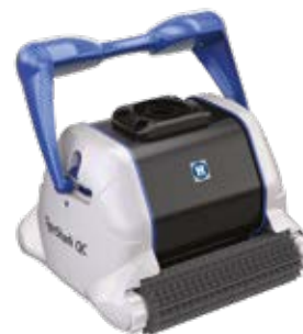
TigerShark® QC Version Noppenbürste