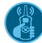
ROAM-Fernbedienung Seite 137 ROAM XL-Fernbedienung Seite 138