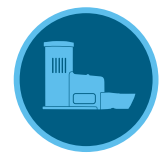
Rain-Clik-Sensor Seite 144