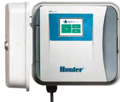
HPC (Kunststoff Innen-/Außenmontage) Höhe: 22,9 cm Breite: 25,4 cm Tiefe: 11,4 cm